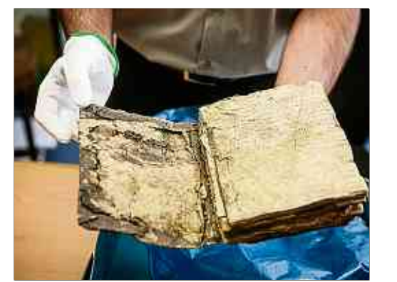
Aufgabe 3: Restaurieren und Sichern

Besucher im Archiv haben nicht auf alle historischen Stücke Zugriff – allein schon, weil sie allzu leicht zerstört werden könnten. Aktuell ist zum Beispiel ein Kooperationsprojekt mit der Universität Luxemburg zu Ende gegangen. Im Rahmen von „Editio“ wurden seit 2011 alle 421 Pergamenturkunden des Diözesanarchivs restauriert und für die Forschung erfasst. Und diese Arbeit geht weiter: Beim vorsichtigen „Abscannen“ der historischen Bücher und Dokumente, aber auch Fotos, Plänen und Karten wird noch mehr über den Inhalt erfasst und Stichworte zur Beschreibung (Ortsangaben, Angaben zu Personen zum Beispiel) hinzugefügt. Dadurch können Archivnutzer schneller zu den für sie relevanten Antworten kommen. Zum Teil arbeiten die Archivare auch schon Quellensammlungen für die Forschung vor. Fachaufsätze des Teams für bestimmte Gemeinden oder zu Kontexten wie zur Glaciskapelle fassen zusammen, was an Bestand vorhanden ist. Eine große Frage – nicht nur für das Diözesanarchiv – aber wird für die Zukunft sein, wie schon heute rein digitale Daten einmal für die Nachwelt erhalten werden sollen. Disketten, gebrannte CDs oder Festplatten haben bei weitem nicht die Langlebigkeit und Lesbarkeit wie ein Pergament. Und was passiert mit wichtigem Email-Verkehr? Was wird wie aufbewahrt werden müssen, damit spätere Generationen Zugang zu unserem Wissen und Vorgängen erhalten?